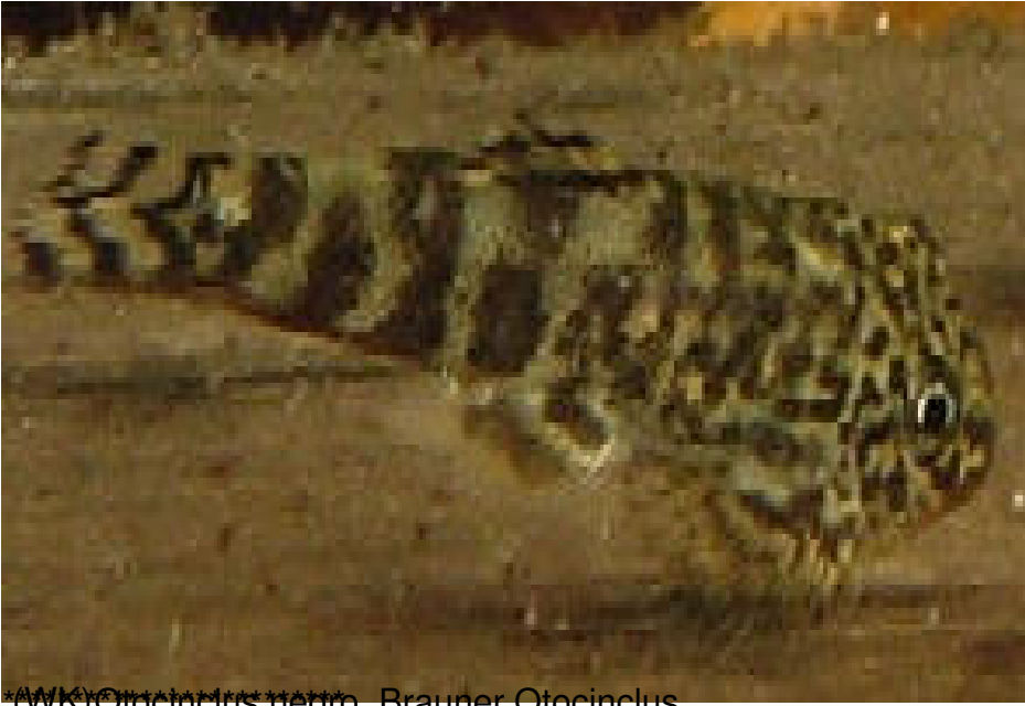
(WIK) Otocinclus negro, Brauner Otocinclus

Mittwoch, den 03. Oktober 2012 um 13:18 Uhr - Aktualisiert Sonntag, den 18. November 2012 um 12:05 Uhr